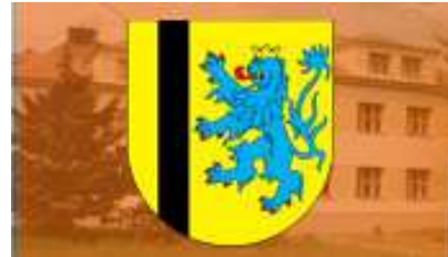
Obecní úřad Svijany